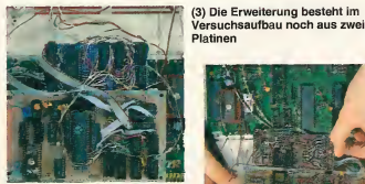
(4) Von unten sieht man deutlich die Stifte für den Anschluß an die CPU 6510

ten Sie den Prozessor aus und ersetzen ihn durch eine 40polige Präzisionsfassung. Danach folgen dann die beiden RAMs. Auch sie werden durch jeweils eine Präzisionsfassung ersetzt. Für den Aufbau der Schaltung verwenden Sie am besten eine doppelte Lochrasterplatine im Epsilonformat (10 x 160 mm). Stecken Sie in die Fassungen Stiftleisten und setzen die Lochrasterplatine auf. Die Stiftleisten müssen jetzt in die Bohrungen der Lochrasterplatine eingeklebt werden. Danach werden diese auf der Oberseite verlötet. Die Platine kann nun wieder abgenommen werden. Die Fassungen der neuen Bauteile werden eingelötet und alle Verbindungen nach Schaltplan vorgenommen. Von der Lochrasterplatine führen nur zwei Leitungen zum Expansion-Port. Alle anderen Verbindungen zur C-64-Platine erfolgen mit den Stiftleisten zum Prozessor und den beiden RAM-Bausteinen.